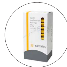
Tour de recharge de rack