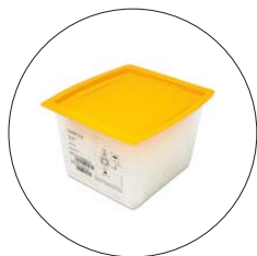
Boîte de pointes en vrac

Les pointes certifiées sans DNase, RNase et endotoxines sont marquées d'un point orange ● dans le tableau.