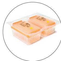
Recharge de rack