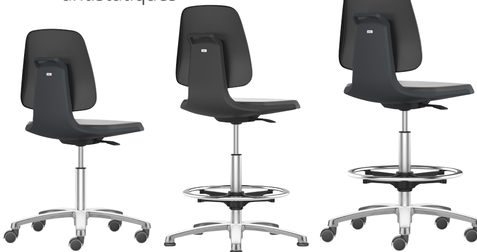
1 Labsit 2 sur roulettes, hauteur assise 450 - 650 mm