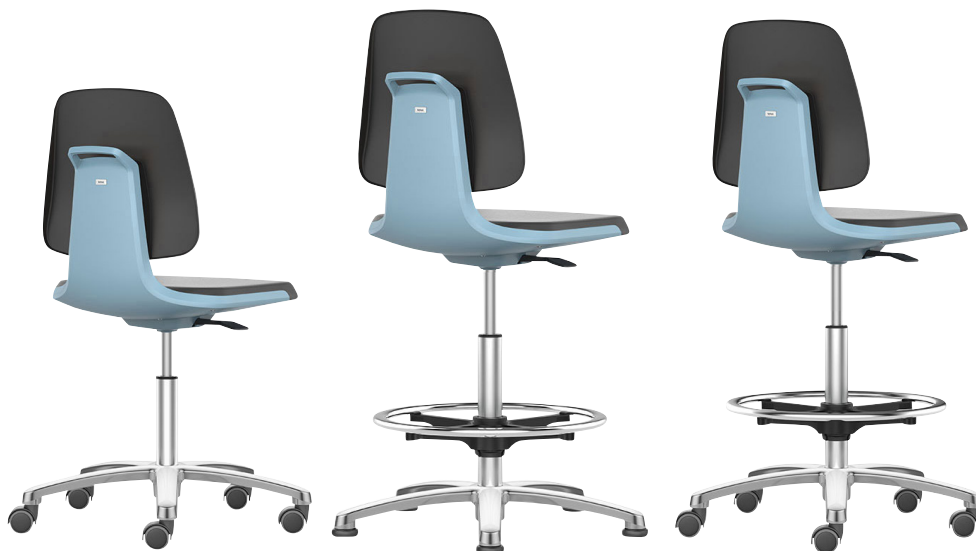
1 Labsit 2, sur roulettes, hauteur assise 450 - 650 mm