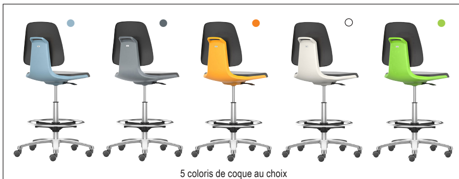
5 coloris de coque au choix