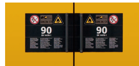
Signalétique compacte, simple et claire.