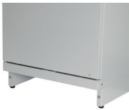
socle sans plinthe