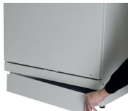
socle avec plinthe aimantée