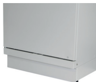
socle avec plinthe