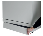
socle avec plinthe aimantée