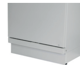
socle avec plinthe