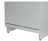
socle sans plinthe