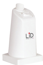
interrupteur classique ON/OFF