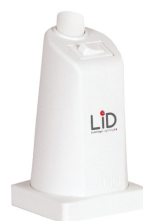
interrupteur classique ON/OFF