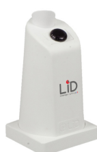
interrupteur sans contact