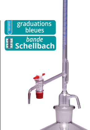
graduations bleues bande Schellbach