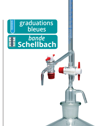
graduations bleues bande Schellbach