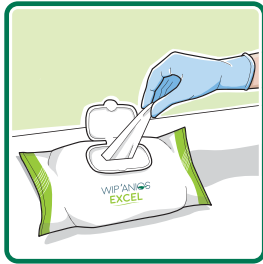
Prendre une lingette