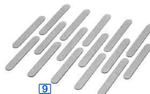
Bandes magnétiques pour sachets