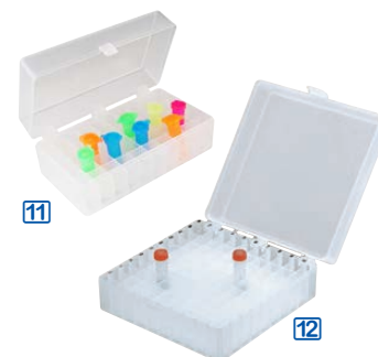
Boîtes magnétiques pour microtubes