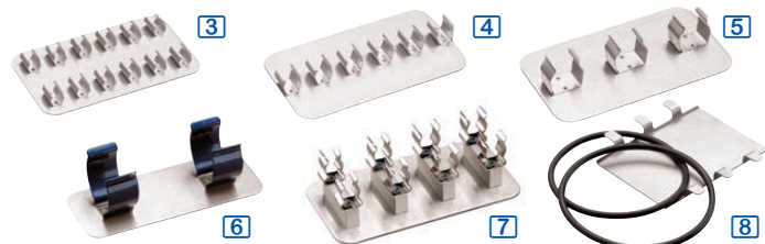
Portoirs magnétiques à pinces, pour tubes