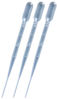
1 pipettes non stériles en vrac