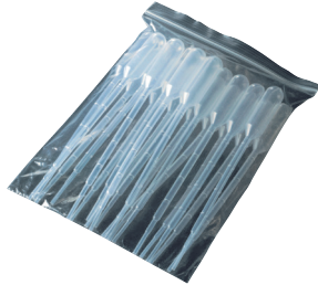
2 pipettes stériles en emballage par 20