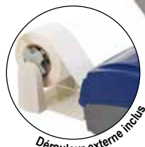
Dérouleur externe inclus