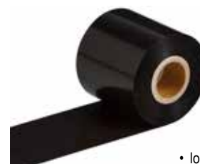
• longueur 70 mètres