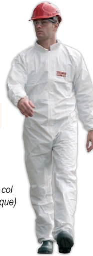
combinaison à col (livrée sans casque)