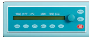
Panneau de commande type "C"