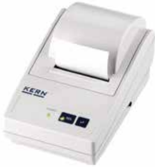
Imprimante à aiguilles papier classique