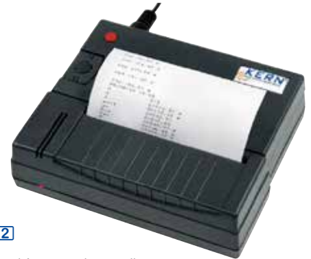
Imprimante BPL statistiques