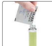
ajouter le réactif