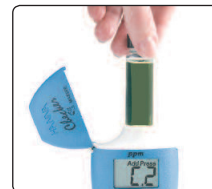
insérer la cuvette