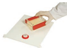
Table de niveau pour gel

Plaque avec niveau à bulle pour ajuster l'horizontalité du gel lors du coulage.