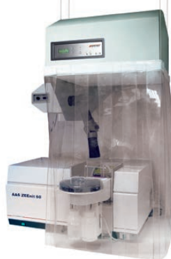
3 Chambre avec système extracteur