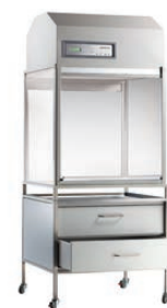
enceinte à flux laminaire + support à tiroir