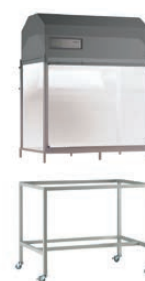
enceinte à flux laminaire + support sur roulettes