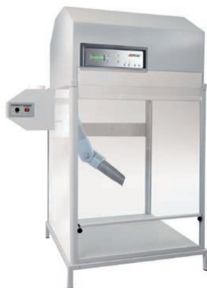
2 Enceinte et système extracteur