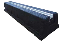
Base support du moteur

Les ventilateurs d'extraction sont livrés complets avec interrupteur de proximité et protection thermique du moteur.