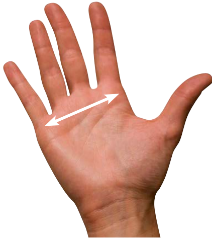
taille des gants