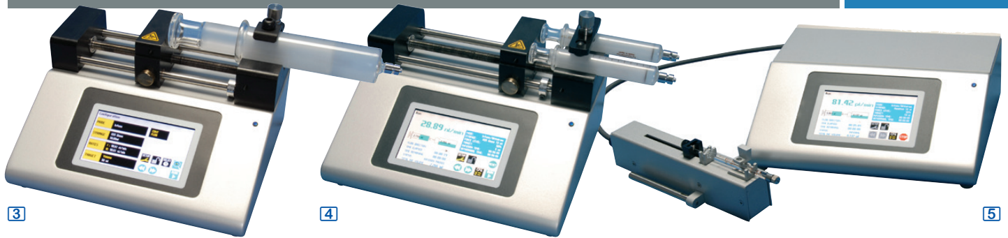
pousse-seringues perfusants à programmeur standard