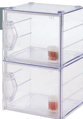
1 + 1