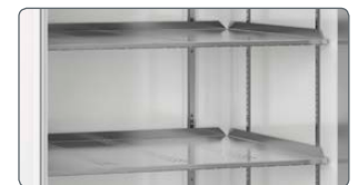
Livré avec 5 plateaux