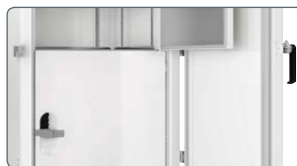
Deux portes internes