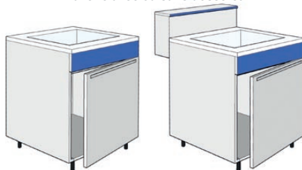
4 sans dossier