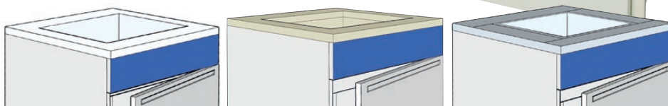
1 cuve monobloc en grès émaillé