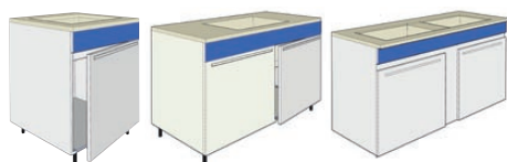
larg. 600 mm