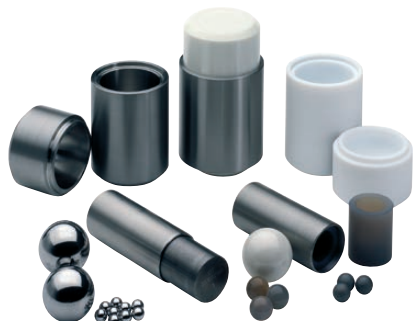
Bols et billes pour MM200.