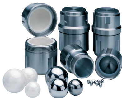
Bols et billes pour MM400.