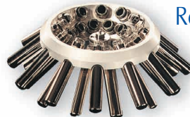
Rotor angulaire 24 places pour tubes 15 ml, tubes à hémolyse et microtubes 1,5 ml