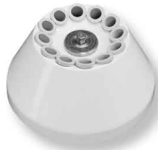
Rotor angulaire 12 places pour tubes Falcon® 15 ml, tubes à fond rond 15 ml ou tubes à hémolyse