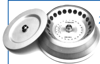
Rotor angulaire pour 24 microtubes 1,5 ml, 0,5 ml ou 0,4 ml