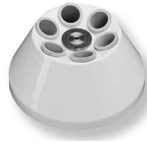
Rotor angulaire 6 places pour tubes Falcon®, ou tubes à fond rond 15 ml et 50 ml