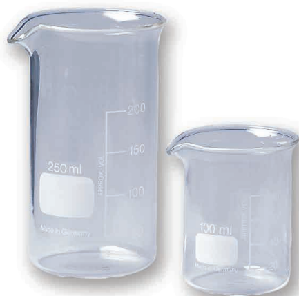
béchers forme haute et basse