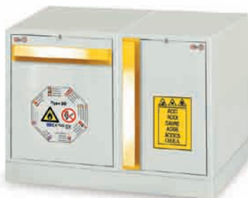
C + K sur socle LMF900 (combinaison 1)