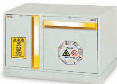
L + F sur socle LMF1000 (combinaison 3)