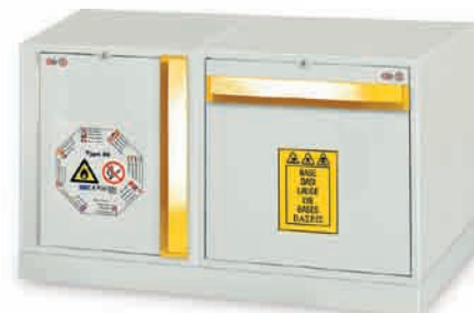
B + P sur socle LMF1100 (combinaison 2)

Un ensemble modulaire est composé d'un socle et de coffres de sécurité .