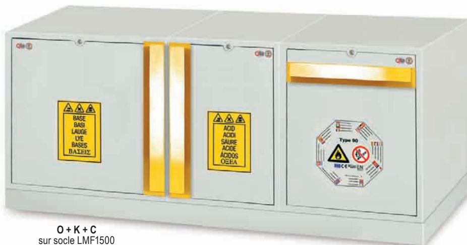
O + K + C sur socle LMF1500 (combinaison 3)