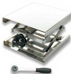
clé à cliquet livrée avec les modèles à charge maximum 60 kg pour faciliter l'élévation