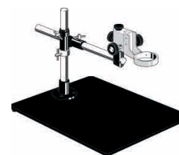
XE5024 [6] Statif antistatique

pour les contrôles des circuits électroniques (SMD), plateau noir laminé 500 x 500 mm, colonne Ø 29 x 360 mm, tête réglable en hauteur, bras horizontal orientable, long. 340 mm, sans éclairage