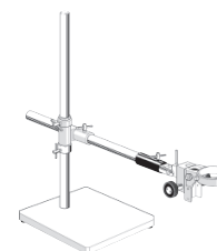
XE5023 [5] Statif à tête articulée

statif avec socle 270 x 270 mm, colonne Ø 29 x 610 mm, tête orientable réglable en hauteur, support d'éclairage orientable, sans éclairage