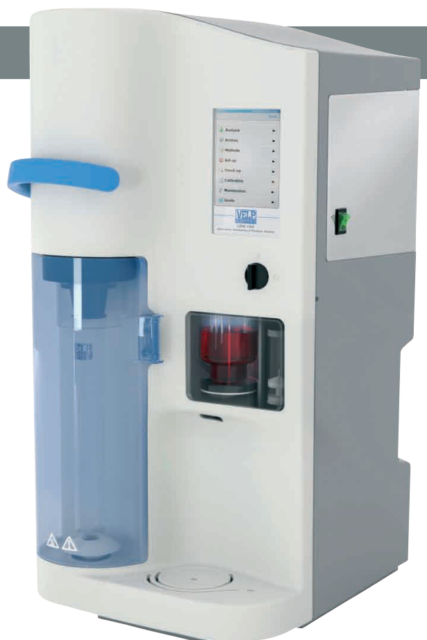
UDK159 avec titrateur incorporé