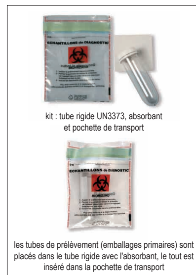
kit : tube rigide UN3373, absorbant et pochette de transport

les tubes de prélèvement (emballages primaires) sont placés dans le tube rigide avec l'absorbant, le tout est inséré dans la pochette de transport