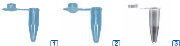
1 tubes autoclavables avec capuchon solidaire plat