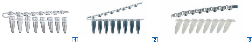
1 barrettes de 8 tubes solitaires avec barrettes de 8 capuchons naturels à dôme