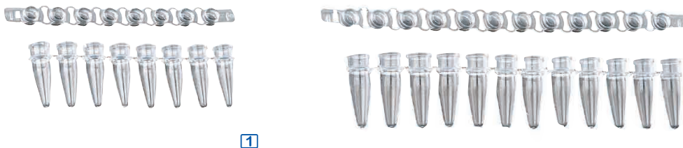
1 barrettes de 8 tubes et barrettes de 8 capuchons à dôme naturels